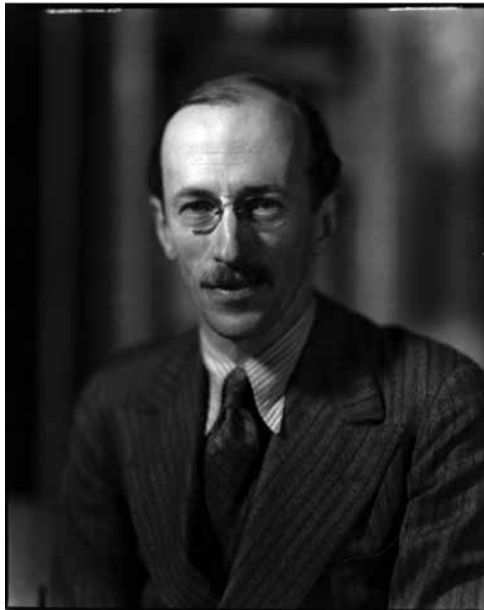
Sir Basil Henry Liddell Hart (By Howard Coster, National Portrait Gallery, 1934)

Fuente: Howard Coster, 1934. National Portrait Gallery. Central Office of Information, Londres, 1974. http://www.npg.org.uk/collections/search/portraitLarge/mw48996/Sir-Basil-Henry-Liddell-Hart . Consultado el 27 de septiembre de 2016.