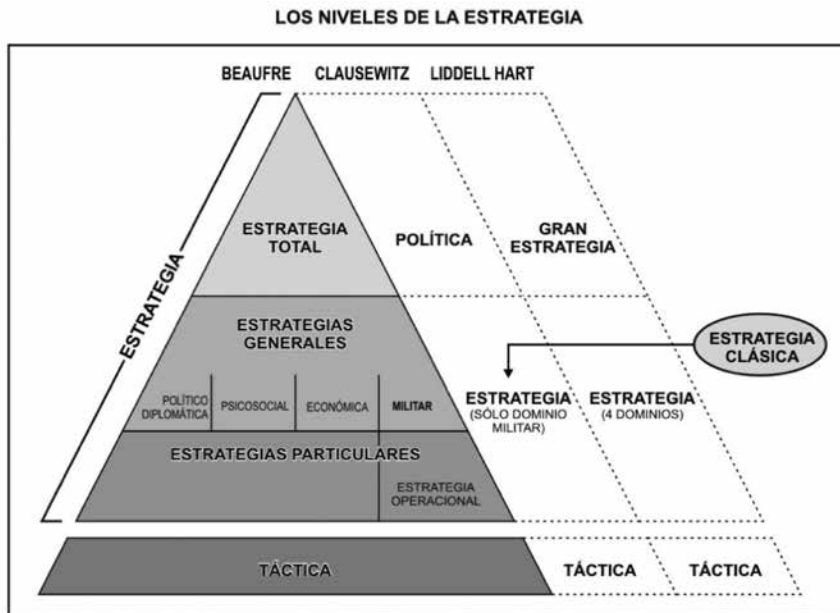
Figura 1. Niveles de la Estrategia 29