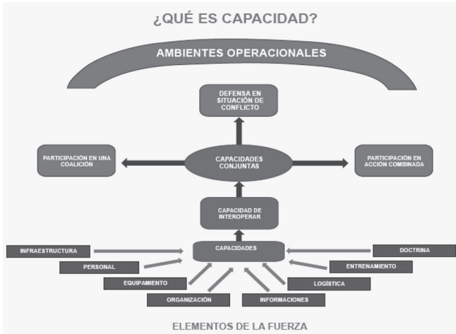
Figura 1: Definición de capacidades de la fuerza nacional